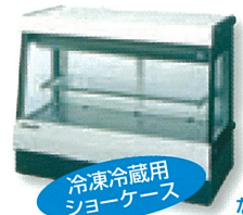
冷凍冷蔵用 ショーケース